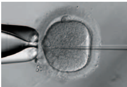
ICSI-Methode: Die Spermien werden in die Eizelle «hineingezwungen».

zungstechnikern eine «klinische Embryonenvernichtung» eingeleitet, eine Abtreibung.