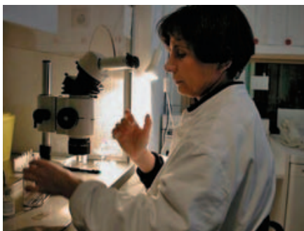
Zeugung im Reagenzglas.

Noch ernüchternder fällt die Bilanz aus, wenn man nicht nur die Schwangerschaftserfolgsquote anschaut, sondern auch die Entbindungs-Erfolgsquote, das heisst, die Zahl der Geburten. Sie liegt noch einmal deutlich niedriger. Pro Behandlungszyklus liegt sie bei gerade einmal 15,2 Prozent.